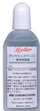
希釈液 (油性) 内容量: 30ml