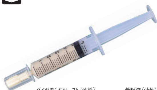
ダイヤモンドペースト (油性) 内容量: 5g